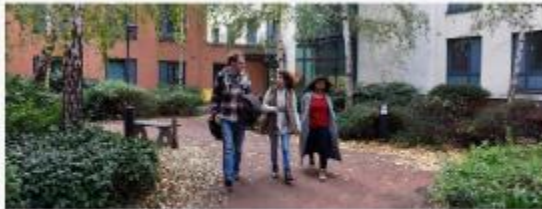
Cutty Sark Hall

https://www.youtube.com/watch?v=ygL2pUhRRLA&t=7s