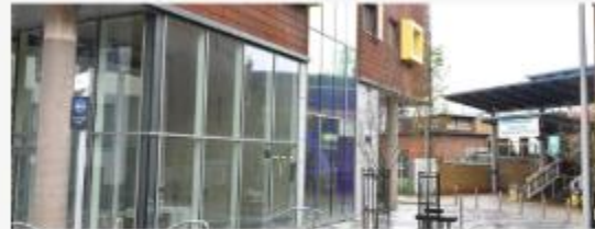
Daniel Defoe Hall